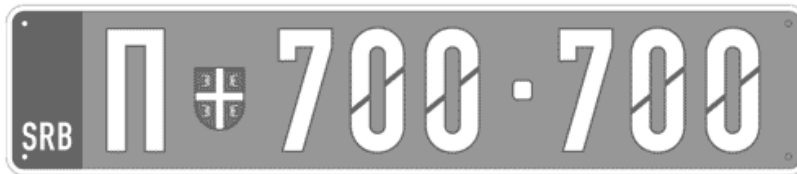
Цртеж бр. 17