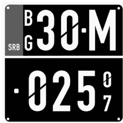
Цртеж бр. 14