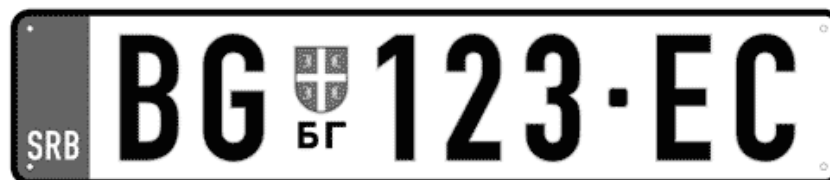
Цртеж бр. 2