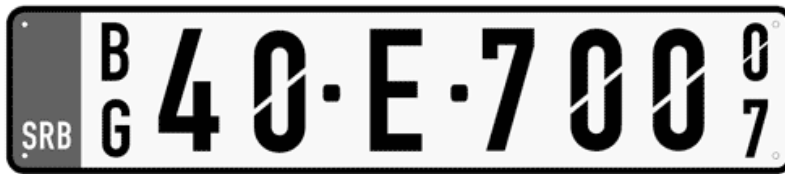
Цртеж бр. 8