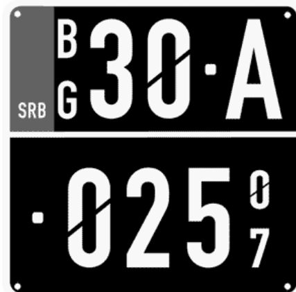
Цртеж бр. 13