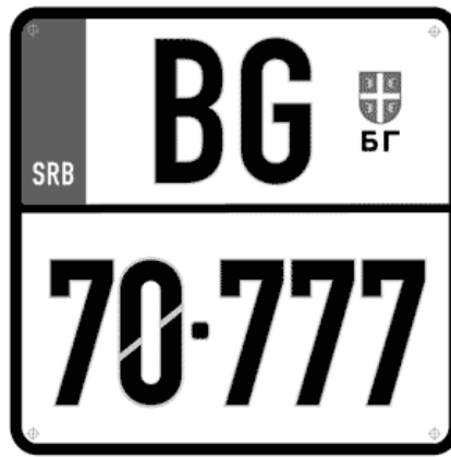
Цртеж бр. 3