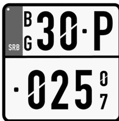
Цртеж бр. 15