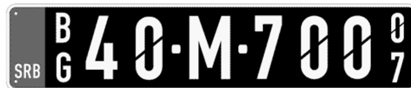
Цртеж бр. 6