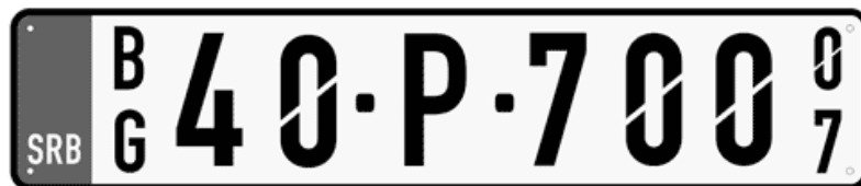
Цртеж бр. 7