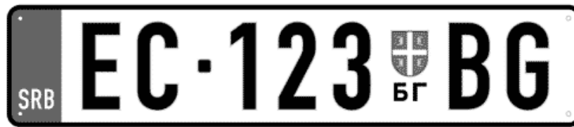
Цртеж бр. 4