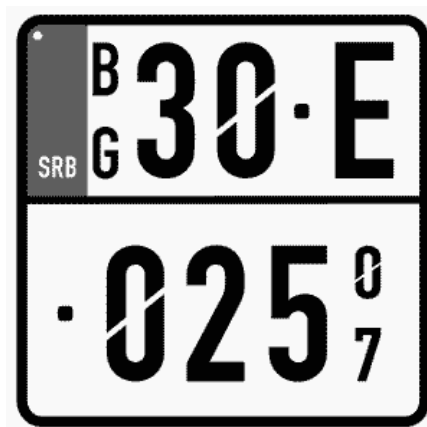
Цртеж бр. 16