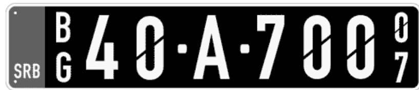
Цртеж бр. 5